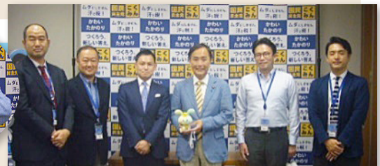
訪問した組合役員とかわい議員