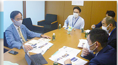
説明を聴くかわい議員